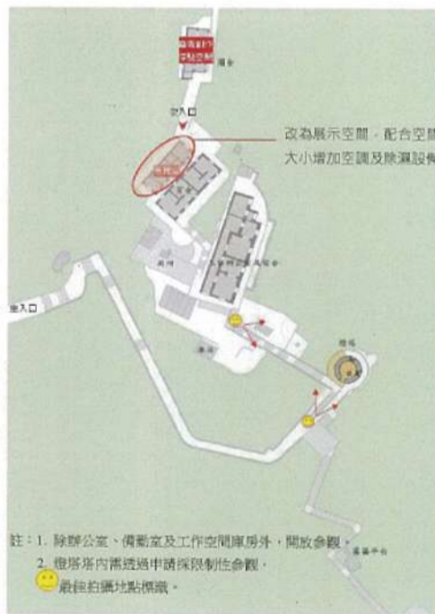
東湧燈塔修復及再利用構想圖