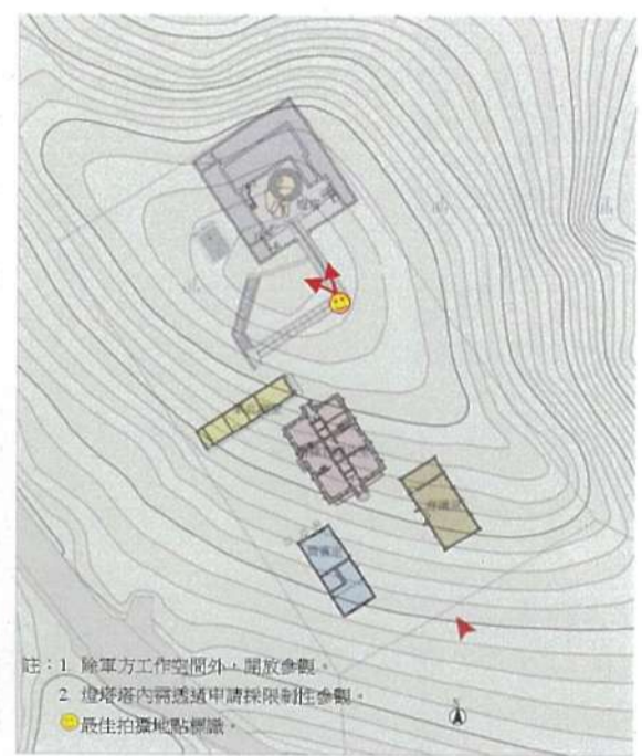
烏坵燈塔修復及再利用構想圖