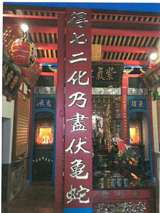
鹿港紫極殿黃天素書法楹聯