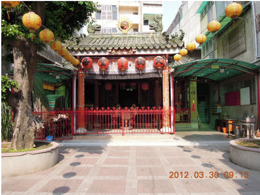
照片一(說明): 入口外觀