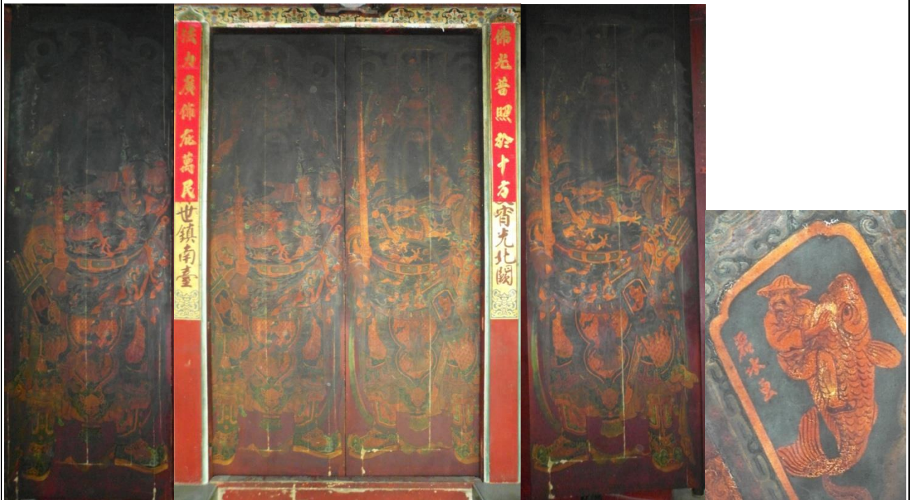
照片二(說明): 正殿門神