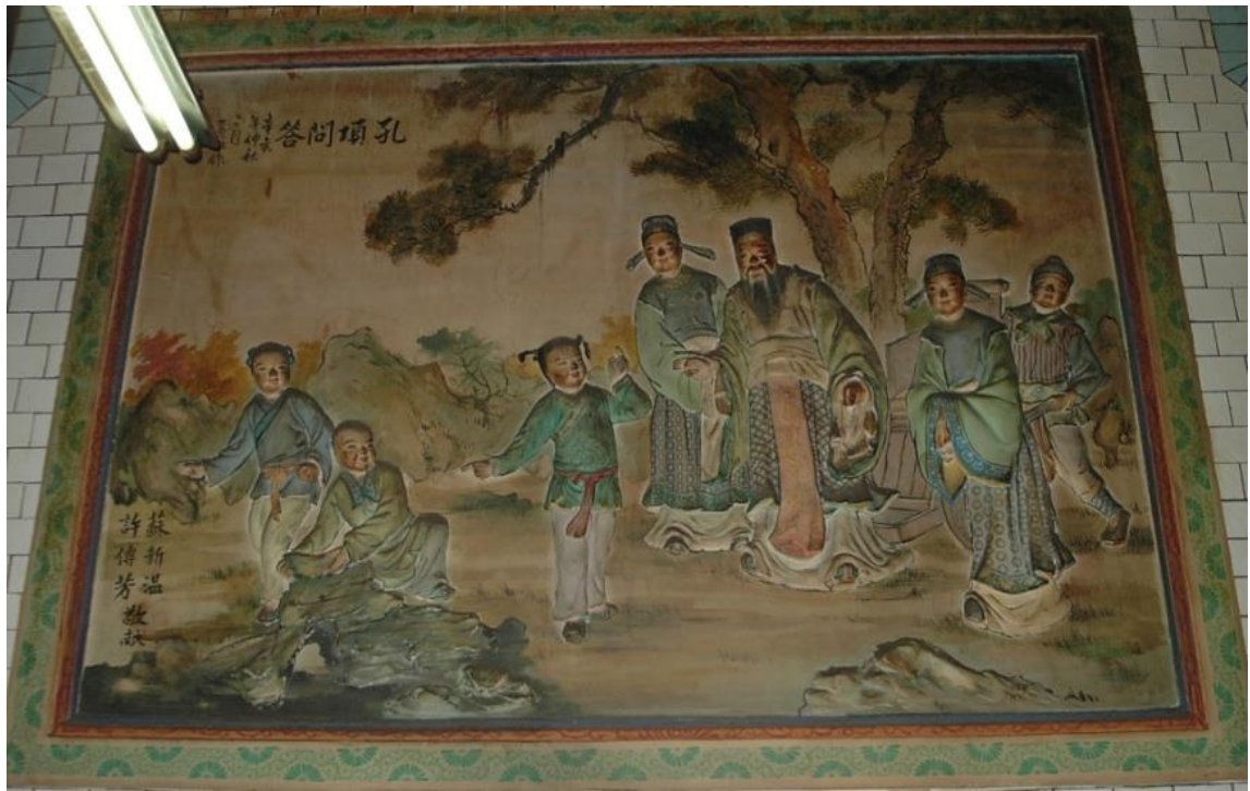
照片五 (說明): 虎邊泥塑壁畫