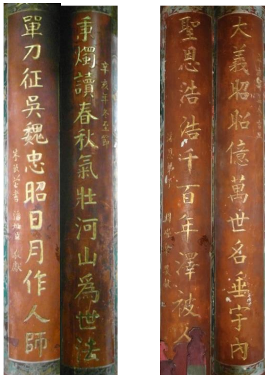
照片六 (說明): 檐廊兩側立柱書法