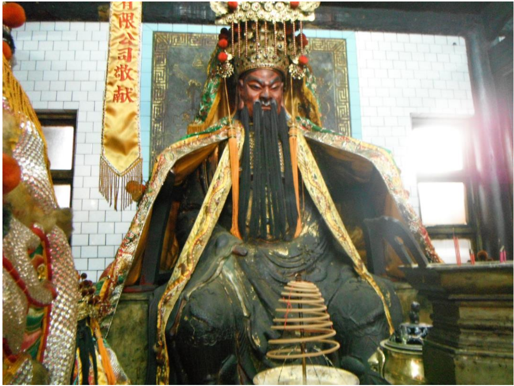
照片三 (說明): 正殿泥塑神像