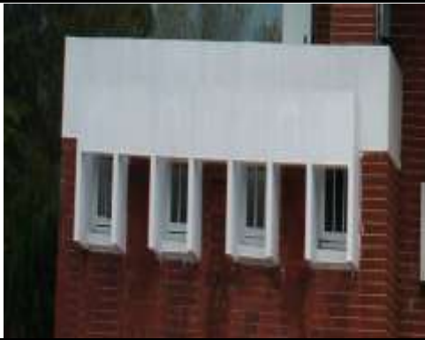
透過水平線條感強調重複性的韻律