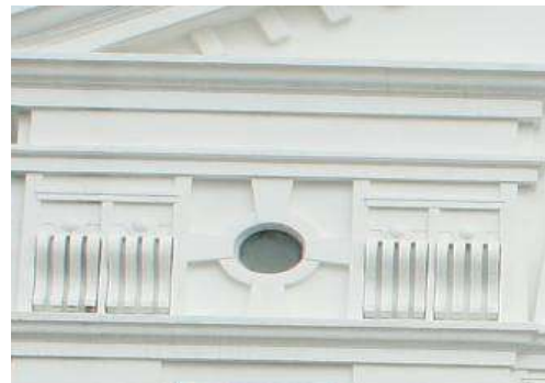
入口處柱間壁細部