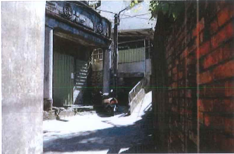
圖 2 由仁安街 37 巷進入便可到達