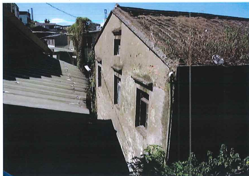
圖 4 西側為空地，為單棟住宅