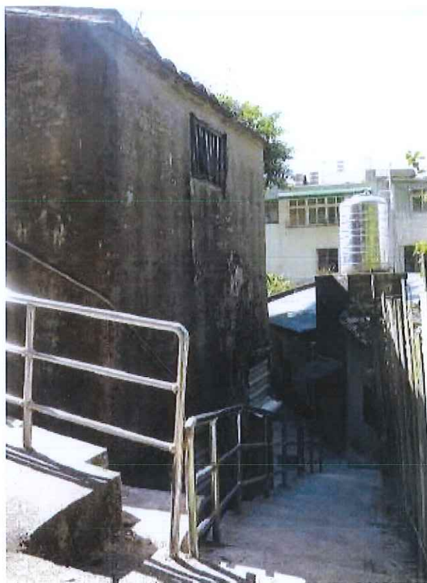
圖 5 建物東側為空地，地勢前低後高，設有階梯