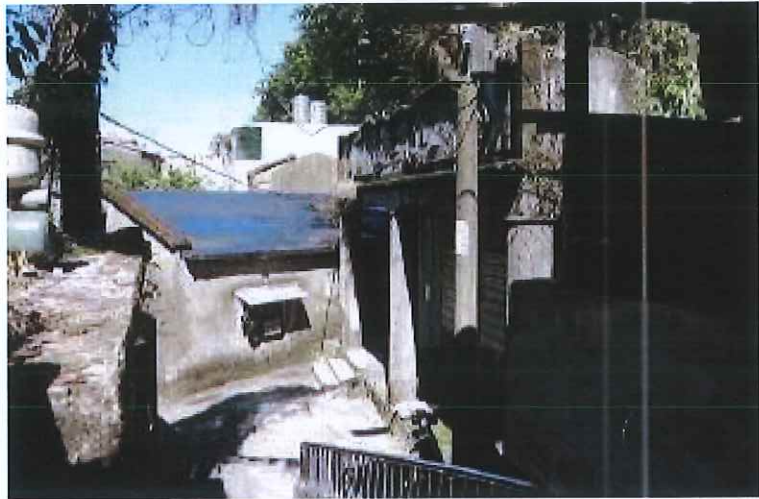
圖 3 仁安街 37 巷一景