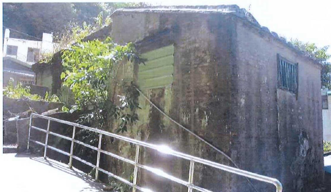
圖 6 因地勢前低後高，故在二樓另設進出口，方便進出