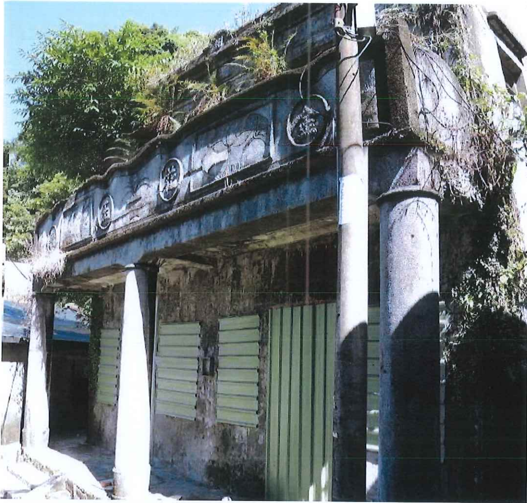
圖 1 仁安街港務局宿舍(原謝宅)正立面