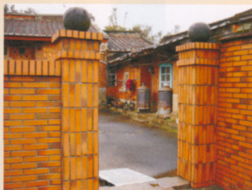
▲圖十：修建過的「文筆柱」