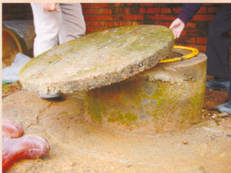
▲圖六：與祖堂同齡的古井

祖堂左側方的竹園邊，有古井為拓墾時期所開鑿；曾提供一百五十名採茶工加上七十餘名長工同食共浴，可見水源的充沛；井邊都還可以清晰看到磨刀、利鋤的弧形痕跡(圖六)。