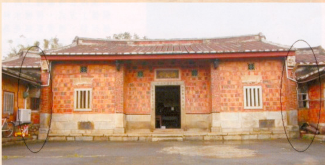
▲圖十二：線條標示處為「塌壽」。圈起處為多出的隅間，使堂屋形成「五見光」的空間安排。

中央內埕來說，由於正堂與左右兩橫屋皆有在中央明間作出退凹的「塌壽」(圖十二)，使三個面向的入口孔道，皆有做出前簷廊，為「斗子砌」磚造房子相當氣派的處理手法。堂屋的正面處理，除中央三開間外，在與左右內橫屋交接處，有多出一角隅間，處理成窗孔，形成客家民居最常看到的「五見光」空間安排(圖十二)。