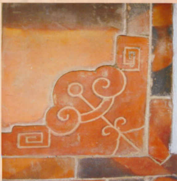
▲圖二十三：正廳內撻角