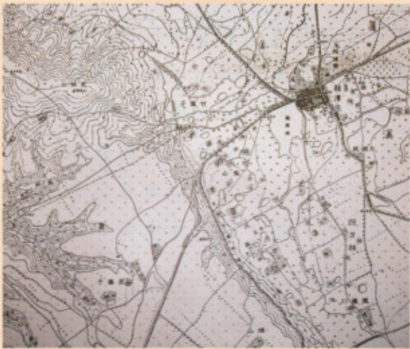
◀圖二：西元1925年軍部圖