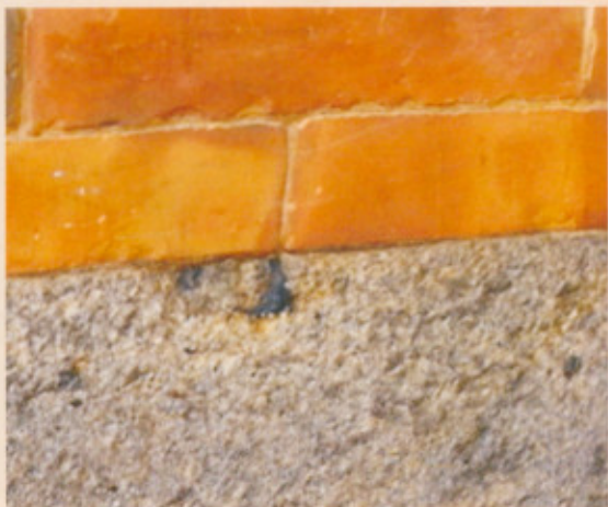
▲圖十六：右側塌壽銃孔

為防禦的需求，黃宅有在正堂明間塌壽的兩側，於磚縫間及磚石交接處，作出左右兩側的「銃眼」(或稱銃孔)，目前右側已封死(圖十六)，只剩下左側有銃孔(圖十七)。