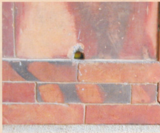
▲圖十七：左側塌壽銃孔