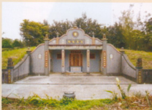
▲圖八：科文公派下祖墳

內橫屋與堂屋有藉一道圍牆將它隔成一內院，出入孔道偏到左側(東南側邊)，有一對門柱，頂部原有磚柱頭，上頭還有小尖頂，黃家子弟說是「文筆柱」，圍牆上還有二十五洞修長孔眼的「馬鼻縫」，為用磚疊砌的磚柱直槿漏空洞窗(圖九)，可惜近幾年已經被改築過，圍牆改為水泥牆柱，雖有貼相做的紅色貼面磚，仍是非常假，連尖頭文筆柱也被改為大圓球(圖十)。