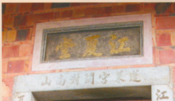
▲圖三十：正身右側泥塑

倒是正堂明間大廳外的大門，一橫兩豎的石板條，有凹刻門聯字樣，橫聯寫著「蓬萊宮闕對南山」（圖三十）。