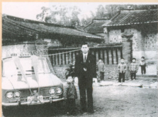
▲圖九：舊馬鼻縫牆、文筆柱

內橫屋與堂屋有藉一道圍牆將它隔成一內院，出入孔道偏到左側(東南側邊)，有一對門柱，頂部原有磚柱頭，上頭還有小尖頂，黃家子弟說是「文筆柱」，圍牆上還有二十五洞修長孔眼的「馬鼻縫」，為用磚疊砌的磚柱直槿漏空洞窗(圖九)，可惜近幾年已經被改築過，圍牆改為水泥牆柱，雖有貼相做的紅色貼面磚，仍是非常假，連尖頭文筆柱也被改為大圓球(圖十)。