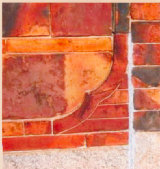
▲圖二十二：塌壽處撻角

裝飾來說，外磚牆體的邊角與正堂明間大廳的磚牆體，皆有利用「撻角」裝飾作成框邊，外牆體較簡單(圖二十二)，內牆則以如意捲雲雕飾作框圈(圖二十三)。