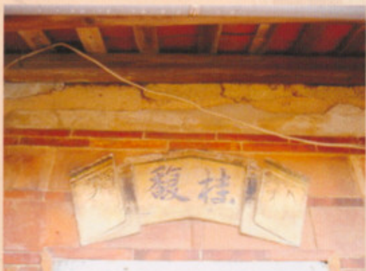
▲圖二十六：左內橫屋右側泥塑一桂馥