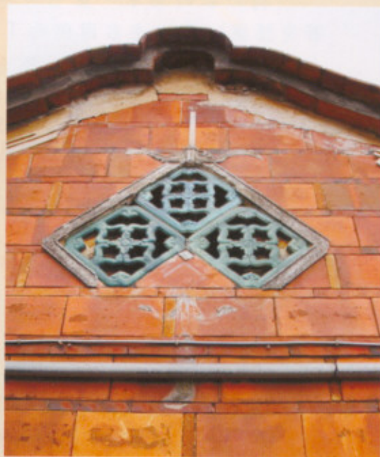
▲圖二十：右內橫屋山繪