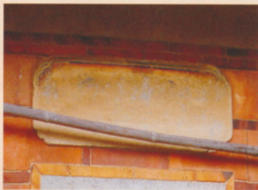
▲圖二十七：左內橫屋左側泥塑