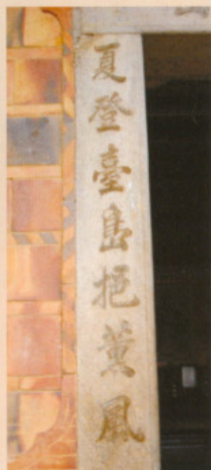
▲圖三十二：右側對聯

左側邊對聯為「江發鄖陽涵盛德」（圖三十一），右側邊對聯則寫著「夏登臺島挹薰風」（圖三十二），門上方還有一匾聯，橫書「江夏堂」（圖三十）。