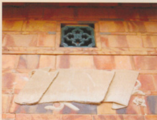
▲圖二十五：正身右側泥塑