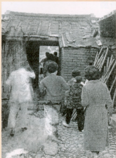
▲圖十一：老照片中可見的卵石鋪地

內橫屋外側與圍牆交接處，有向內埕加築一小室，提供儲藏與浴室，圍牆則築在裡側，但內橫屋好似一彎曲的手臂抱向內埕，外橫屋則向外再多拉出一小房間，內外橫屋間再由內橫屋外作一「過水廊」互為接連，內大手臂向中央彎曲，外長手臂向外伸出，使屋外第一道正向面好似螃蟹的大小手臂。內外橫屋間有一石條內院，昔日皆以鵝卵石鋪地，相當樸實。老照片甚至還看得到，連接左右兩內橫屋間，還有一鵝卵石鋪排的明溝排水設施，再於入口方向放石板鋪面(圖十一)。