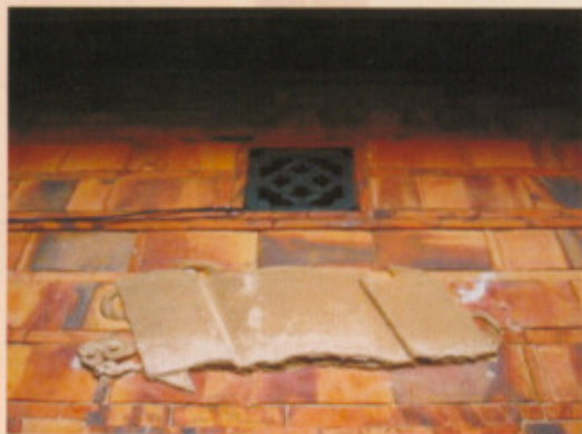
▲圖二十四：正身左側泥塑

馬背山牆來說，橫屋部份有向外展現裡「火」型，外「水」型的兩種不同造型，至於正堂部分則以簡單的「火」型作展現。至於每個石作直櫺窗上，皆有以泥塑作出書卷造型裝飾，再於其上提字，可惜年代久遠，已看不出任何痕跡(圖二十四至圖二十九)。