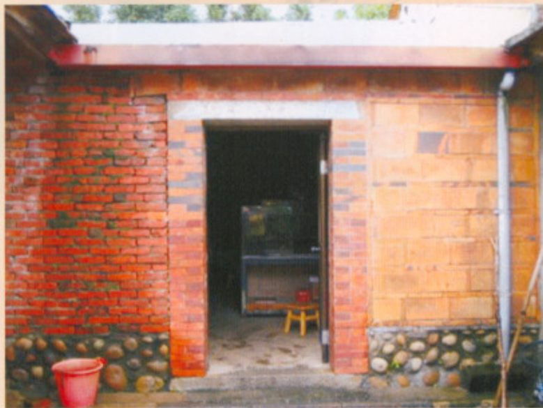
▲圖十五：外橫屋卵石堆砌的牆基

另外圍牆及外橫屋的山牆、過水廊，甚至正堂兩側角的第四、五間，四者的牆基有改換為鵝卵石來堆砌，使牆腳構造有些許的變化(圖十五)。