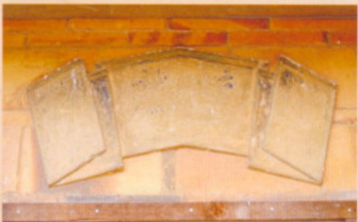
▲圖二十八：右內橫屋左側泥塑一蘭馨