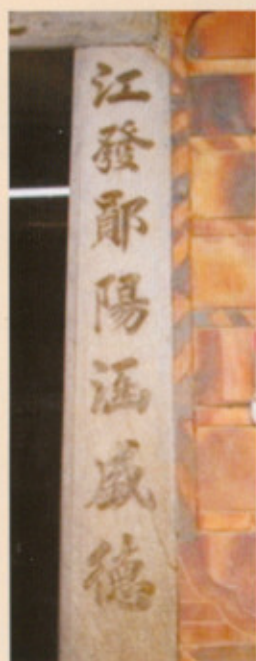
▲圖三十一：左側對聯

倒是正堂明間大廳外的大門，一橫兩豎的石板條，有凹刻門聯字樣，橫聯寫著「蓬萊宮闕對南山」（圖三十）。