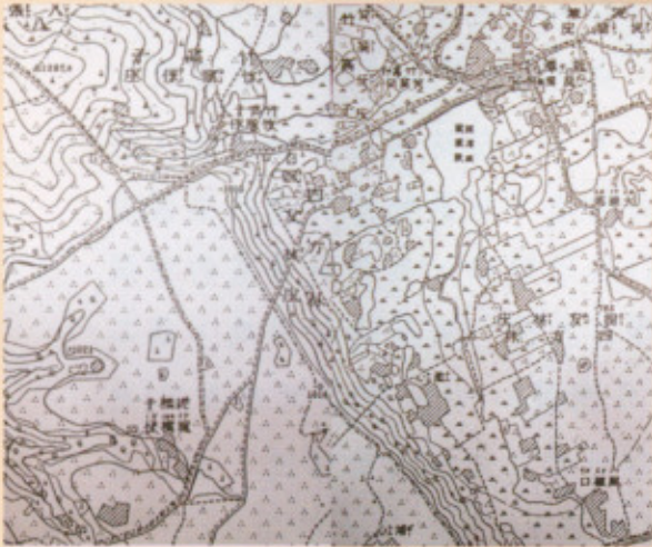
◀圖一：西元1904年台灣堡圖