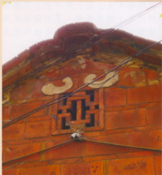
▲圖二十一：右外橫屋山繪