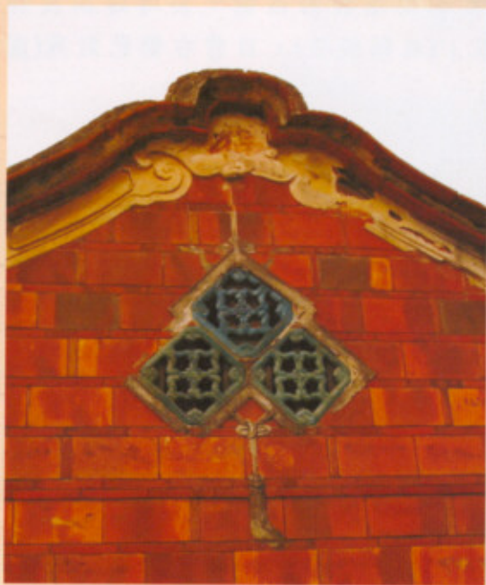
▲圖十九：左內橫屋山繪

外山牆面上的牆頭墜，內橫屋利用三塊綠釉花磚鋪排成氣窗，外面再以泥塑框隔(圖十九、圖二十)：