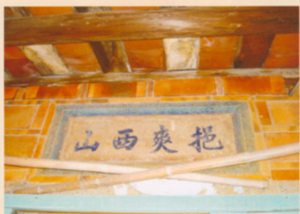
▲圖三十三：左內橫屋門上題字—挹爽西山

左側邊對聯為「江發鄖陽涵盛德」（圖三十一），右側邊對聯則寫著「夏登臺島挹薰風」（圖三十二），門上方還有一匾聯，橫書「江夏堂」（圖三十）。