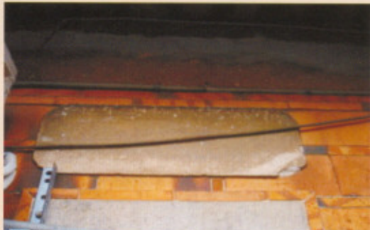
▲圖二十九：右內橫屋右側泥塑