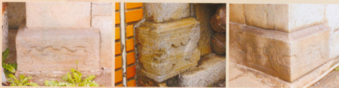
▲圖十八：幾種不同型態的馬櫃抬腳

細部來說，黃宅磚柱牆體底部的石材馬櫃抬腳，有處理成幾種不同型態，有三彎腿形式，有似矮桌面形式，另有以淺浮雕橫雲作成彎腿形式(圖十八)。